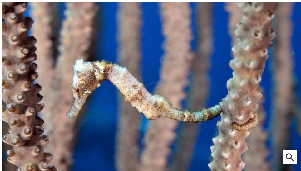
Ein Seepferdchen ( Hippocampus erectus ) in einem Aquarium.