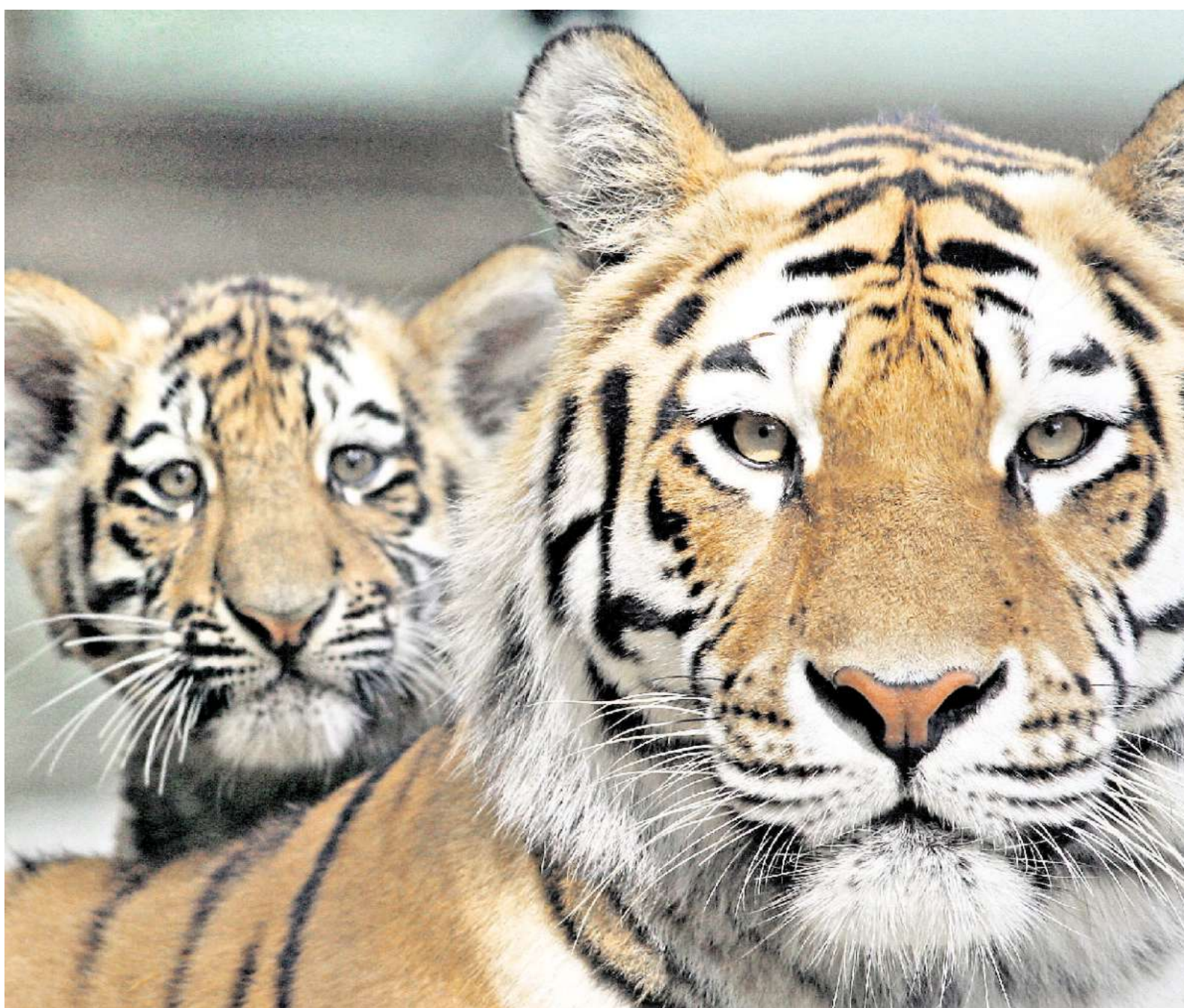
Sibirische Tigerin mit Jungem im Zoo Mühlhausen: Für wilde Artgenossen wird das Überleben noch schwieriger...