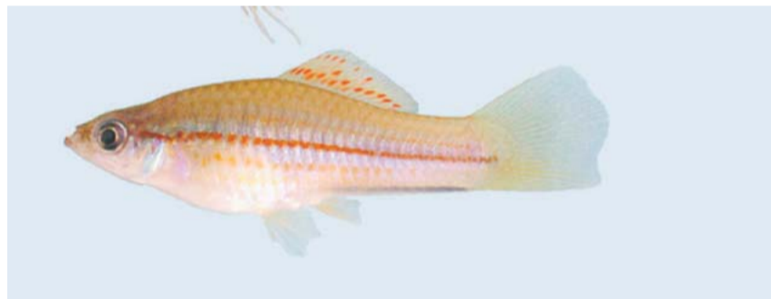
Das Weibchen des Schwerträgerfisches hat keine verlängerten Schwanzstrahlen

Den Fischen wuchsen daraufhin zwei Schwerter: Eines an der ursprünglichen Stelle am unteren Rand und eines am oberen Rand der Schwanzflosse. Die Forscher schloßen aus dieser Beobachtung, dass die zukünftigen schwertbildenden Strahlen schon in der Embryonalzeit oder im frühen Larvenstadium das Wachstum des umliegenden Gewebes mit bestimmten Signalen anregen könnten. Aktiviert wird diese Fähigkeit aber erst mit einer steigenden Testosteronkonzentration, die zur eigentlichen Schwertbildung führt. Allerdings stellten die Wissenschaftler in ihren Versuchen auch fest, dass nicht alle Strahlen der Schwanzflosse oder der Rückenflosse für die Wachstumssignale empfänglich sind. Welche genauen molekularen Mechanismen der Schwertbildung zugrunde liegen, muss noch erforscht werden. CATHERINE GRIM